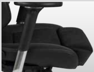
RECARO Office Specialist M: Sitzflächenverlängerung für optimale Sitzdruckverteilung am Gesäß und an den Oberschenkeln