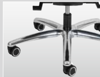
Rollen im Chromring- und Felgendesign für harte und weiche Böden (Option)