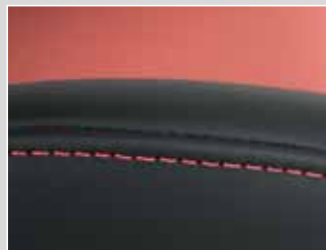
Option: Polster mit farbiger Naht