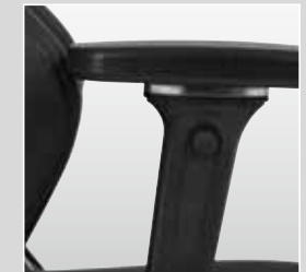
4D Armlehne (individuell einstellbar), optional auch bezogen mit Kunstleder, Leder oder Sonderleder