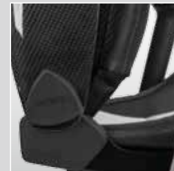
Hochbelastbare Materialien sowohl beim Rahmenaufbau, wie auch bei den Bezugsstoffen.