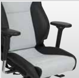
RECARO Office Cross Sportster CS mit flacher Sitzfläche